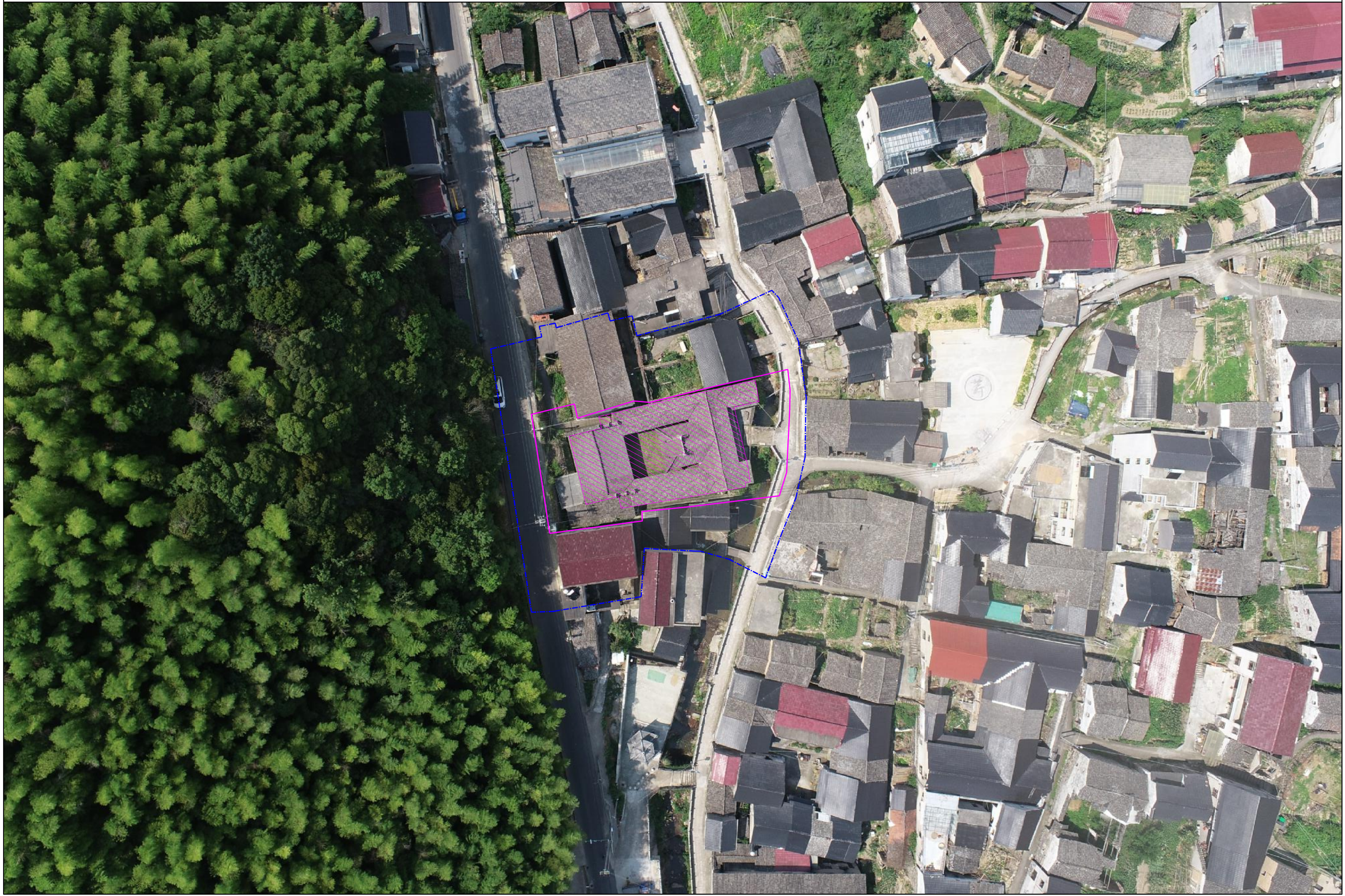
现保护区划+正射影像图