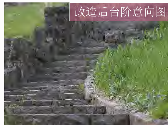
改造后台阶意向图