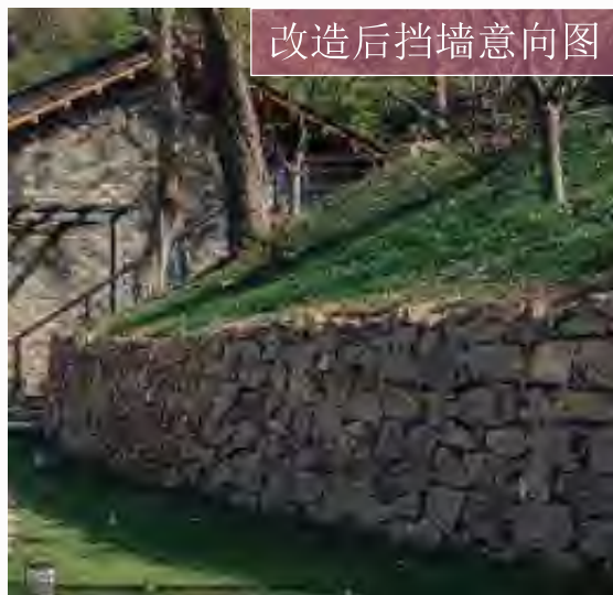
改造后挡墙意向图