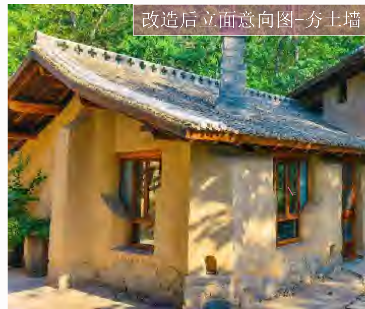
改造后立面意向图-夯土墙

将现有房屋立面改为夯土墙样式，原有走廊部分刷漆翻新，使建筑整体风格统一。改造后房屋的整体风格将焕然一新，既有传统夯土墙的质朴美感，又融入了木制的时尚元素。