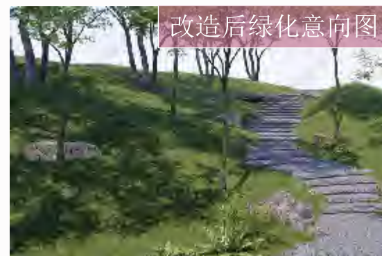
改造后绿化意向图