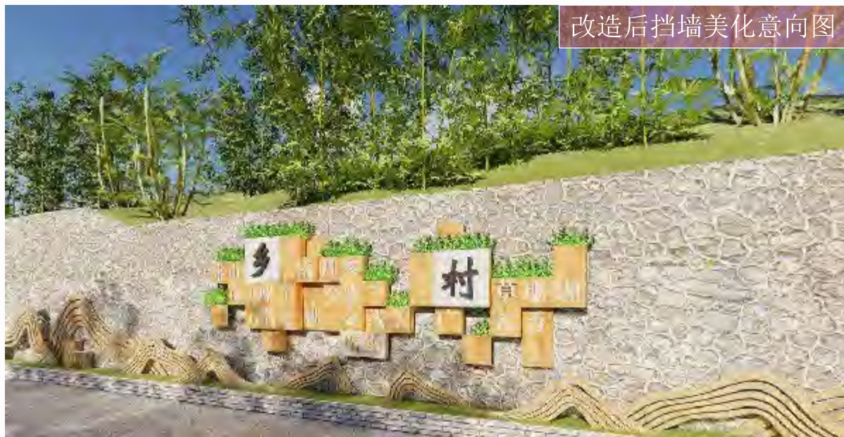
改造后挡墙美化意向图