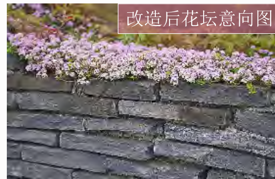
改造后花坛意向图

将原有屋前破损地面更换，新建混凝土地面，不仅展现了人造的艺术美感，且更多的保留了其天生丽质的自然美。在完成加工后，地面带有一丝的典雅之美，给人一种浓烈的返璞归真实感。新建花坛，提升屋前环境。