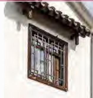
改造后立面意向图-夯土墙