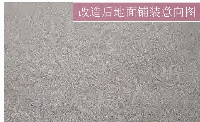
改造后地面铺装意向图