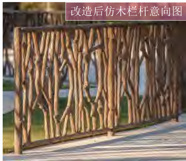
改造后仿木栏杆意向图